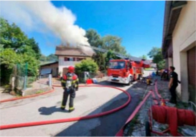
La Commune a pris en charge le relogement de la famille sinistrée.

Dimanche, peu après 13h, la centrale neuchâteloise d'urgence (CNU) a été alertée d'un incendie dans une habitation située rue des Combes, à Lignières, a communiqué hier la police neuchâteloise. Un dispositif d'intervention a été immédiatement déployé: le détachement de premier secours (DPS 2) du Landeron, épaulé par le service de la protection et de la sécurité de Neuchâtel (SPS), a mobilisé 22 sapeurs-pompiers et sept véhicules. L'inspectorat de l'Etablissement cantonal d'assurance et de prévention (Ecap) était également présent sur place. Grâce à leur réactivité, le sinistre a pu être rapidement maîtrisé, même si les opérations se sont poursuivies jusqu'en soirée. La famille relogée Aucun occupant ne se trouvait dans la maison au moment du départ de feu. Une ambulance a été engagée à titre préventif et, heureusement, aucun blessé n'est à déplorer. En raison de l'ampleur des dommages, la Commune a pris en charge le relogement de la famille sinistrée. La police neuchâteloise a sécurisé le périmètre avec trois patrouilles de gendarmerie. Un enquêteur de la police judiciaire et une enquêtrice du commissariat forensique ont été engagés sur les lieux pour déterminer les causes et les circonstances de l'incendie. FRK