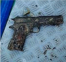
Le pistolet a été remis à la police, qui procédera à des analyses afin de déterminer s'il est lié à une affaire en cours.